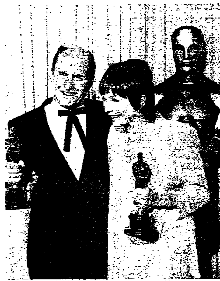
اسعد الفلزيين في العام الماضي: شيرلي مكليين وروبيرت دولف